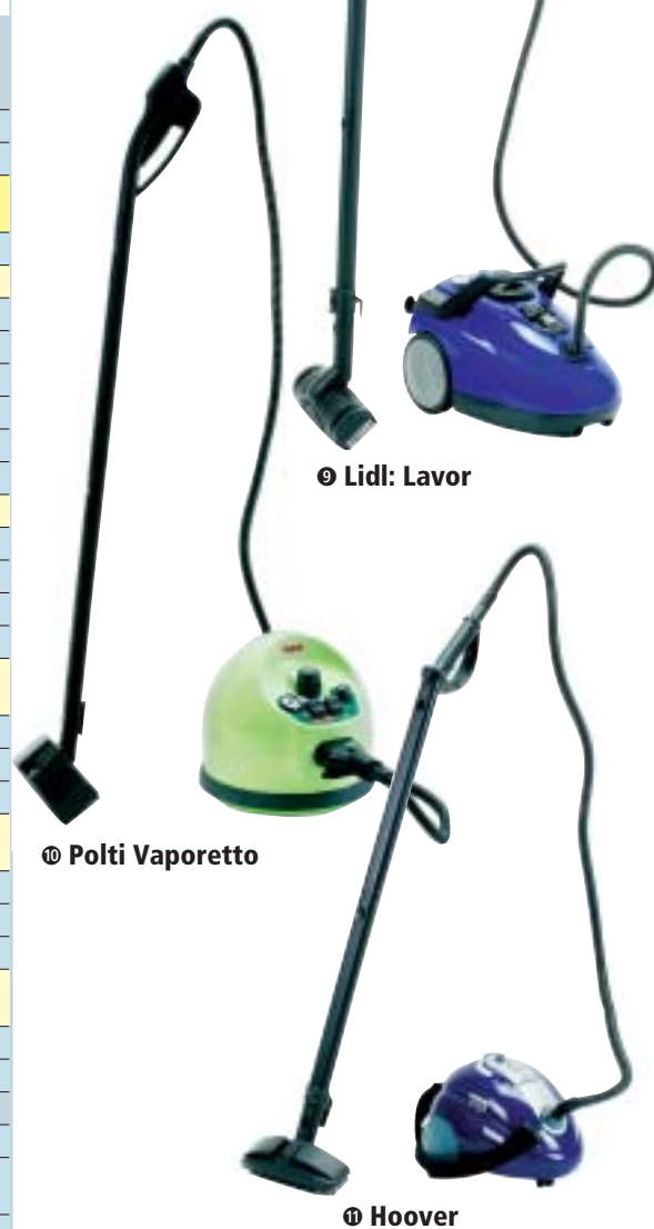
Ⓢ Lidl: Lavor