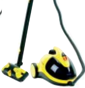
Ⓢ Royal M 380