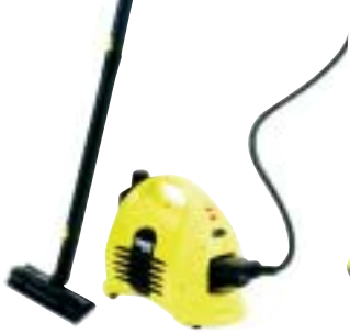
Ⓢ Kärcher SC 1125