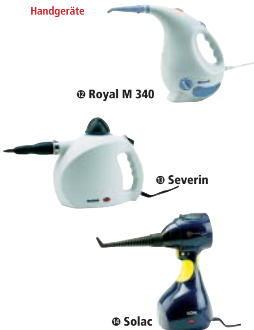
17 Royal M 340