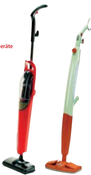
15 Clean Maxx