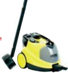
1 Kärcher SC 1402