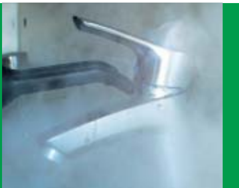
Auf verchromten Armaturen hinterlassen die Dampfreiniger oft streifige Spuren.

Auch auf den anderen Oberflächen konnten die Dampfreiniger nicht richtig glänzen. Auf der Küchenarbeitsplatte hinterließen sie ebenfalls oft einen klebrigen Film. Beim Fensterputzen waren Tropfenspuren und Schmutzränder an den Stel-